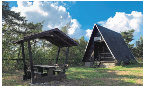
Jugendbaute „Weißer Stein“